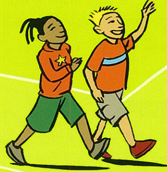
तेज़ चलना / धीरे दौड़ना