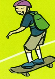
स्कैटस पे चलना